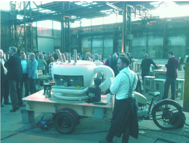
De maaltijd catering is in handen van LunaWorX

Amsterdam School of Management (ASOM) in samenwerking met CAMU, Go APE!, LunsWorkX, robots.nu, Festina Lente Inc. en Via Traiectum. Het initiatief is gelanceerd tijdens een CAMU-lezing in september 2012 www.asom.org